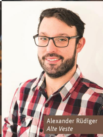
Alexander Rüdiger Alte Veste