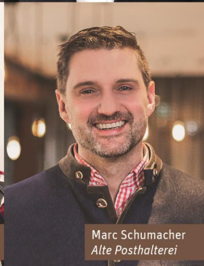
Marc Schumacher Alte Posthalterei