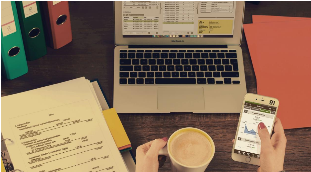
Buchhaltung automatisieren